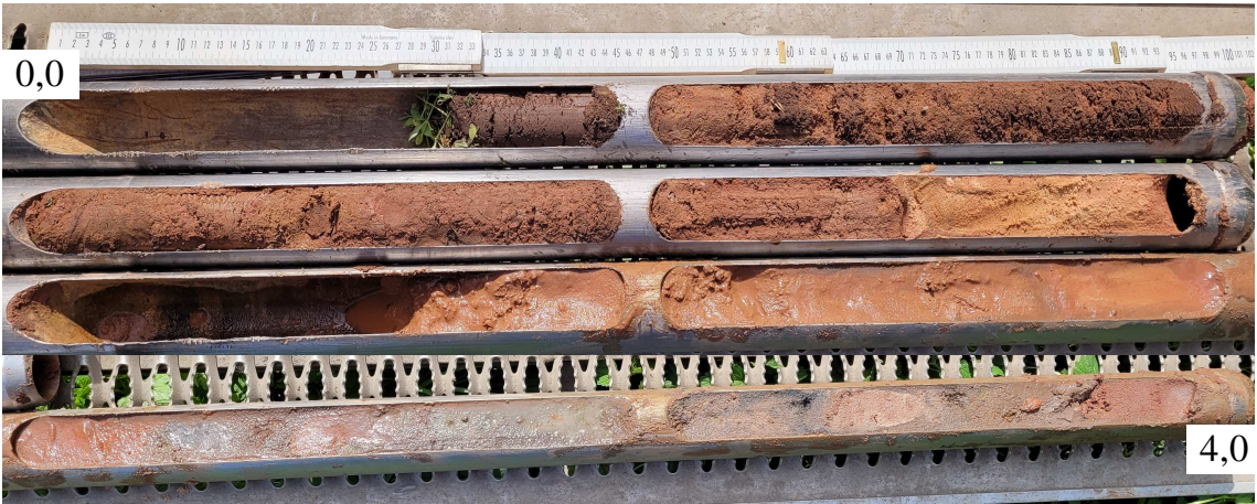
Fotodokumentation BS 1/25

Anmerkung: In den eckigen Kästchen sind die Bodengruppen nach DIN 18 196, die Boden-/Felsklassen nach DIN 18 300:2012-09 und die Frostempfindlichkeitsklassen nach ZTV E-StB 17 angegeben.